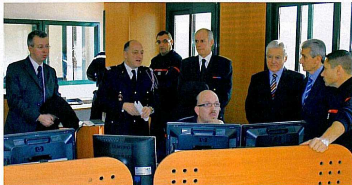
Courant janvier, dans les locaux du Sdis 83 à Draguignan (Var), des autorités, des élus et les médias ont visité les nouvelles installations mises en œuvre pour l'exploitation du Système de coordination des appels et de lancement des alertes, baptisé Scala 83.